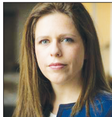
Minister Carola Schouten

E meta prinsipal di e proposishon di lei aki ta pa kontribuí na e mehorashon di e siguridat di eksistensia di habitantenan di Karibe Hulandes, segun e ministerio, pero di e igualdat entre ámbos parti di e pais no tin mension, pasobra e proposishonnan lo hiba e sistema di siguridat sosial solamente mas aleu ku e nivel di e regulashon na Europa Hulandes i tampoko na un